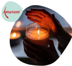
Omgaan met verlies van een dierbare Werkboek